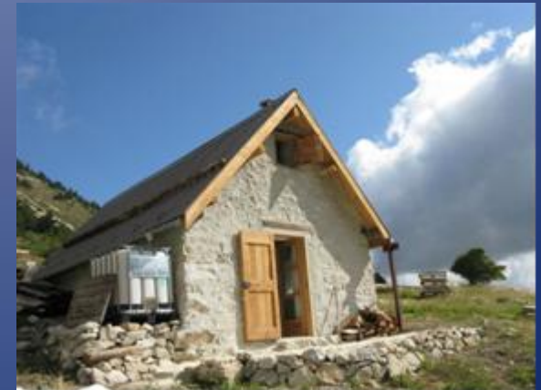
La cabane après les travaux