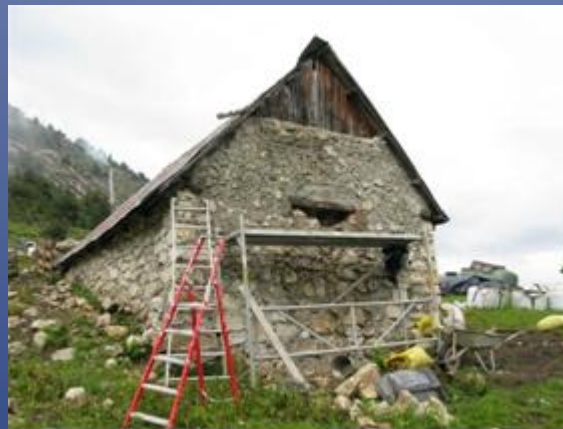
La cabane pendant les travaux