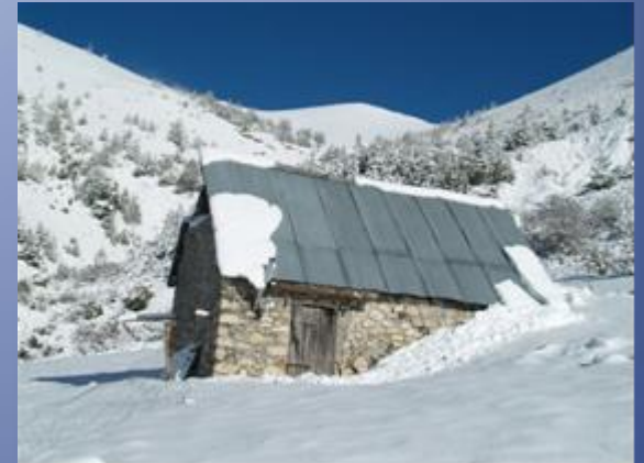
La cabane l'hiver avant travaux

Héliportage, reconstruction de la maçonnerie au BATICHAUX, les enduits et le rejointoiement en plâtre chaux aérienne (DECORCHAUX)