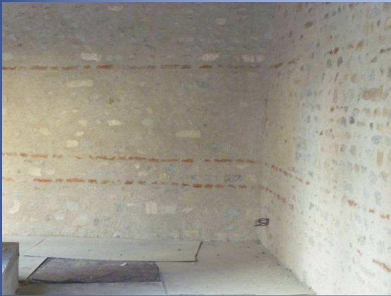
Rejointoiement des maçonneries au mortier de chaux