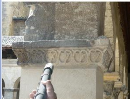
Nettoyage de parements en pierre de taille par procédé de gommage