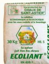
ÉCOLIANT® 30 kg